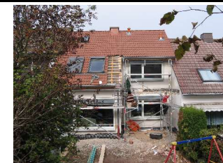
Jetziger Zustand des Gebäudes

Projekt 2: Einfamilienhaus in Trier Baujahr: 1970 Größe: ca. 107 m 2 beheizte Wohnfläche Maßnahme: Sanierung der Gebäudehülle, Einbau einer Holzpelletsheizung und einer Solaranlage Ansprechpartner(in): Jürgen Klaus