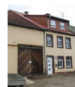
Gebäude nach der Sanierung